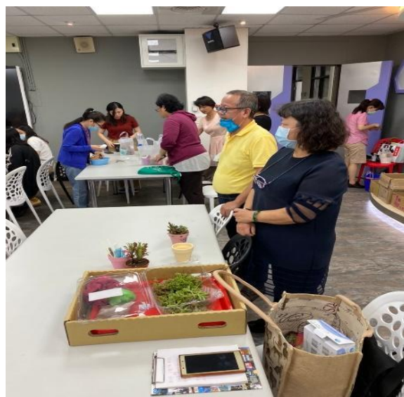
園藝治療師的講解