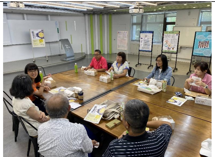
外賓與我校教師討論後新冠時代課程設計與社區合作的可行方案