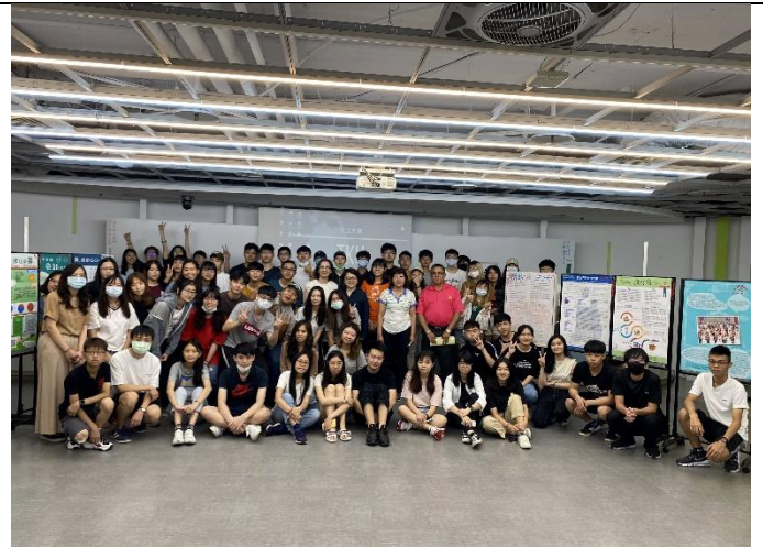
活動中場的大合照