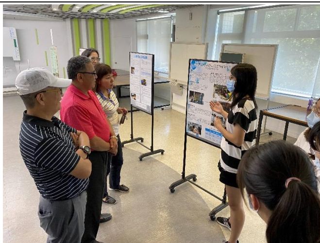
公行系同學以閩南語向新春里里長和鄰長解說社區共餐與安養院供餐的差異