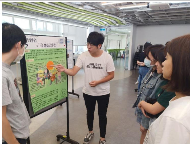
中文系同學和組員訪談、觀察、紀錄與阿公阿嬤一起聽《海波浪》、《望春風》的情境