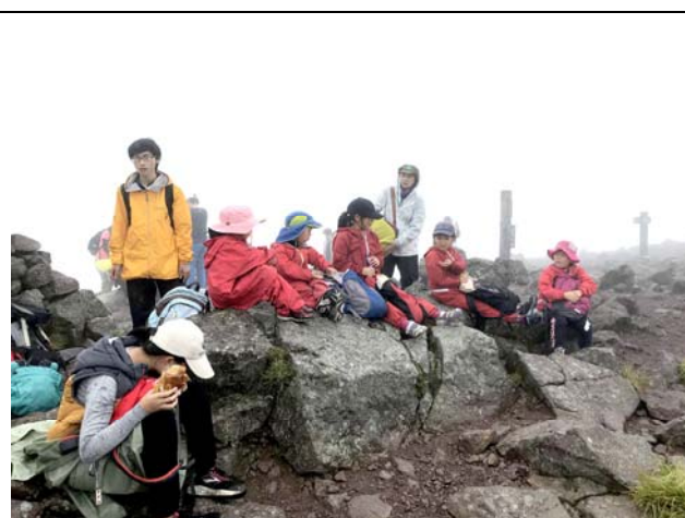
圖 4. 登山活動能促進韌性、體能、團隊力及對自然資源的知能、情意與永續管理的知能