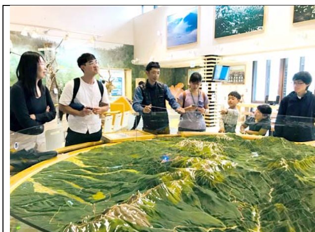
圖 1. 計畫隊員於日本北海道大雪山國家公園遊客中心提供參訪人員到館解說