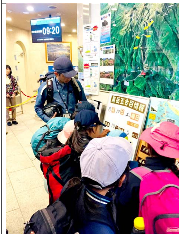
圖 3. 大雪山國家公園不但是重要的水源，也是戶外教育的重鎮